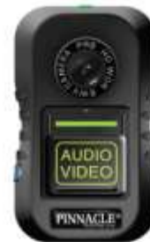
Pinnacle Response (Irlande)