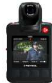
Reveal Media (UK)